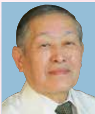
協和ヘルシー センター 施設長