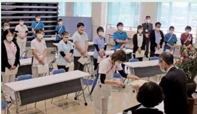
昇格者辞令交付・10年勤続表彰