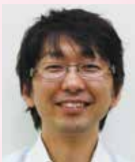
大和クリニック 院長