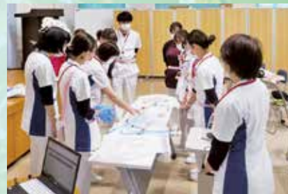
膀胱留置カテーテル講義