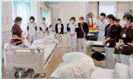
褥瘡予防体位変換演習